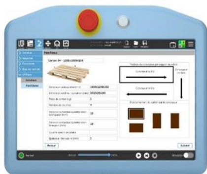
Paramétrage du plan de palettisation : taille de la palette, nombre de couches, position de prise du carton et autres caractéristiques